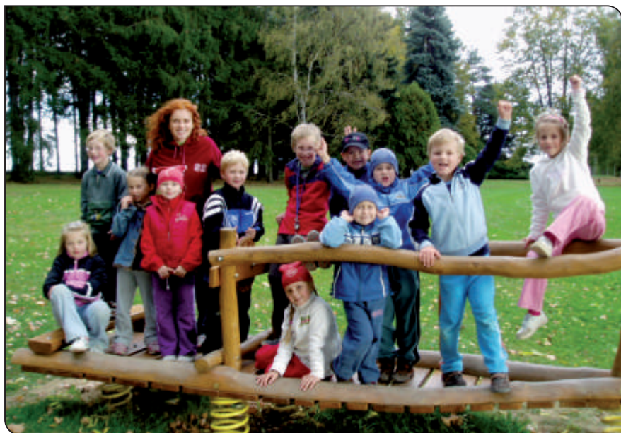
Podzimní procházka po Lanškrouně

Už před rokem navrhli žáci, členové školního parlamentu, zda by nebylo možné zakoupit do šaten v suterénu skříňky. To samozřejmě není levná záležitost, ze školního rozpočtu jsme nakonec zaplatili za šatní skříňky 200 tisíc Kč. A tak 1. září očekávalo nové vybavení v šatnách žáky 7. – 9. tříd. Pokud vstoupíte do šaten, budete se lehce orientovat, protože sedmáci mají jmenovky žluté barvy, osmáci červené, 9.A zelené a 9.B se pyšní modrými. Doufáme, že žáci budou o nové vybavení suterénu vzorně pečovat, skříňky nebudou polepovat různými samolepkami a obrázky... A hlavně nesmí zapomínat klíče nebo je dokonce ztrácet.