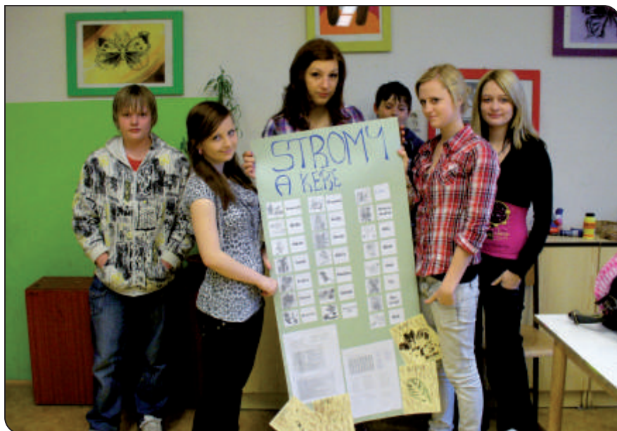
Ekologický projektový den