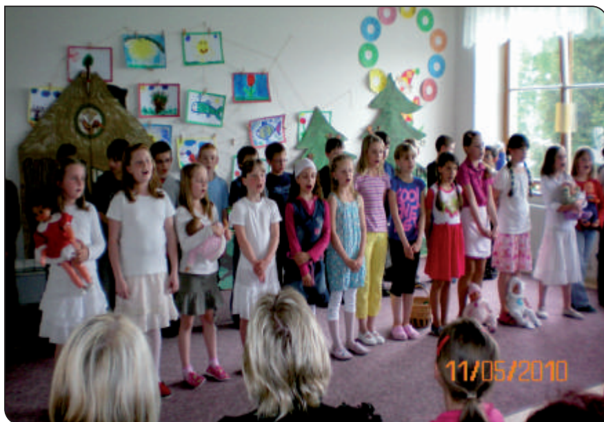
Besídka 3. ročníku ke Dni matek

Dětem se vystoupení moc podařilo a udělaly radost svým maminkám, babičkám i paní učitelce. Protože se pohádka všem velice líbila, předvedeme ji ještě