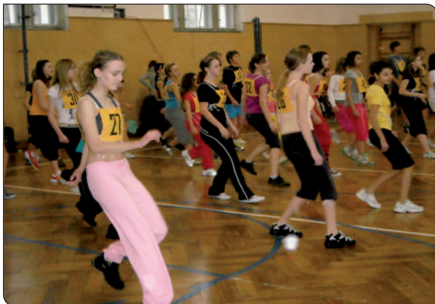
Okresní přebor škol v aerobiku