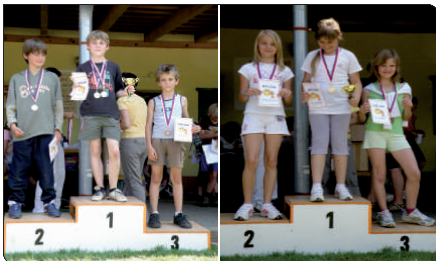
Atletické závody v Rudolticích