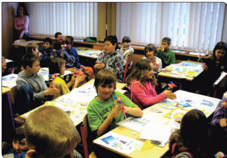
Závěrečné pohádkové zvonění

Největším překvapením pro nás byla noční stezka odvahy s tajemným duchem školy, který budil pozornost i náhodných kolemjdoucích. Nakonec jsme si všichni oddechli – byl to pan ředitel v převleku, který mu ve svém volném čase spíchla paní zástupkyně. Ale někteří žáci se báli tak, že na konci putování si ani nevšimli školního kostlivce. S velkým úspěchem se setkala i večerní dvojjazyčné čtení pohádky Cínový voják. Nezapomněli jsme ani na polské kamarády, kteří nemohli přijet k nám do Čech, s nimi jsme se spojili pomocí internetu a videokamery. Před spaním ve třídách se opět předčítalo, ale tentokrát už z české nebo polské knihy.