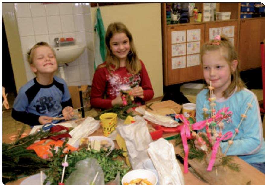
Adventní dílny 1. B