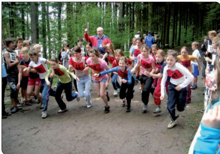
Přespolní běh v Kypuši - start