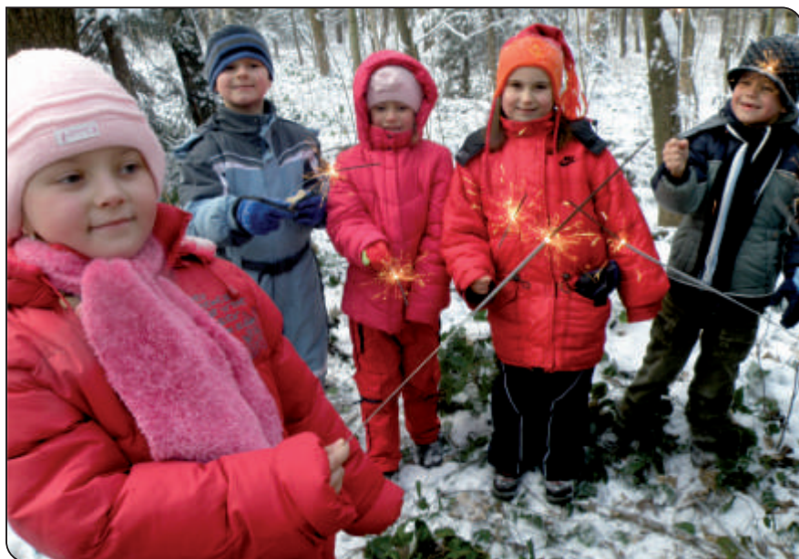
Vánoční nadílka v lese