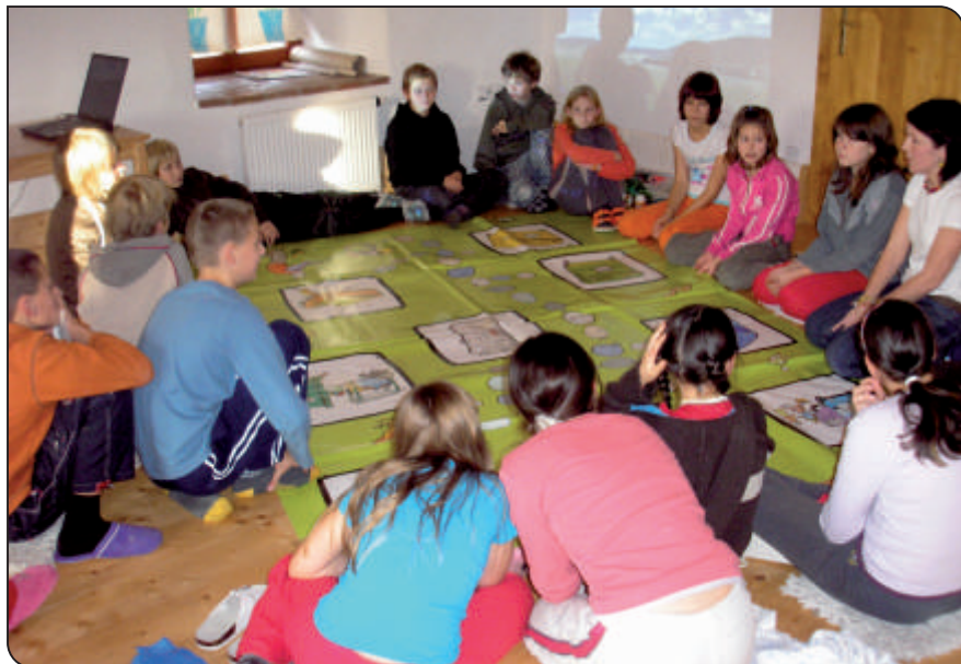
Ekocentrum Paleta v Oucmanicích – 6. třída