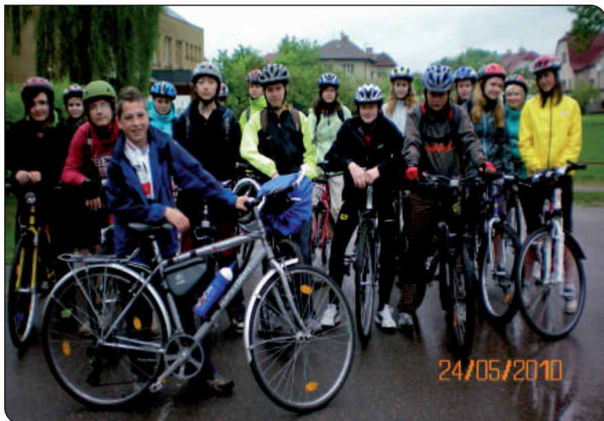
Žáci 8. třídy

- základní pohybové dovednosti jízdy na kole volně v terénu a v méně