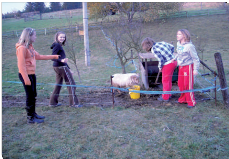
Ekocentrum Paleta Oucmanice, 7. třída, program „Zvířata“

První den si v rámci programu Pečení v peci připravili jednoduché těsto, ze kterého pak v replice historické venkovní pece upekli výborné housky. Žáky pobavil i druhý zvolený program s názvem Zvířata, kde museli přiložit ruku k dílu a se zvířaty se nejen pobavit, ale i se o ně postarat. Druhý den pak žáky čekal program Hry na vsi. Při něm si vyzkoušeli hry, které se hrály už v dávné minulosti a není k nim potřeba nic jiného než pár kamínek, klacíků, fazolí nebo kuliček. Na závěr pobytu žáci při programu Bylinky ochutnali a naučili se poznávat nejběžnější bylinky, zjistili, k čemu se používají, namíchali se vlastní čaj a nakonec si i vyrobili bylinkové mýdlo. Pobyt v Oucmanicích opět splnil naše očekávání. Ve velice příjemném prostředí ekocentra se žáci nejen dozvěděli mnoho nového, ale zároveň se i pobavili a upevnili si vztahy v třídním kolektivu.