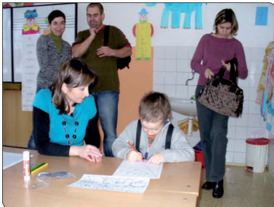
Zápis do prvního ročníku pro školní rok 2010/2011