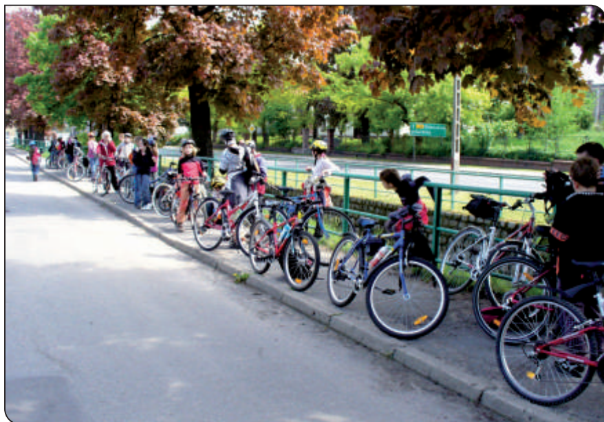
Konečně na kolech

„A konečně už jsme šli do hotelu na večeri. Po ní jsme měli čas na převlíknutí a na nagelování a konečně byla diskotéka.“