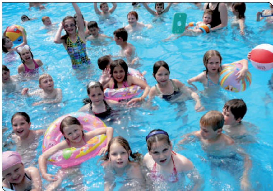
Výlet do Velkých Losin