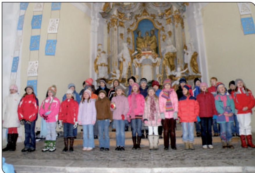
Vánoční koncert 1. stupně v kostele sv. Anny

Příznačná londýnská mlha, ve které se hravě skryje ne jeden zlosyn, se valí i slavnou Baker Street. Za okny domu číslo 221b čeká na svůj nový případ snad nejslavnější světový detektiv – Sherlock Holmes. A po jeho boku věrný přítel, lékař, kronikář a vypravěč jeho případů a lehce natvrdlý pomocník – doktor John Watson... Figura charismatického detektiva nás všechny zaujala svým důvtipem. Zajímavé bylo pojetí doprovodného komentáře z knihy Josefa Škvoreckého, díky němuž jsme se o postavě Sherlocka Holmesa dozvěděli ještě mnohem více než ze samotné inscenace.