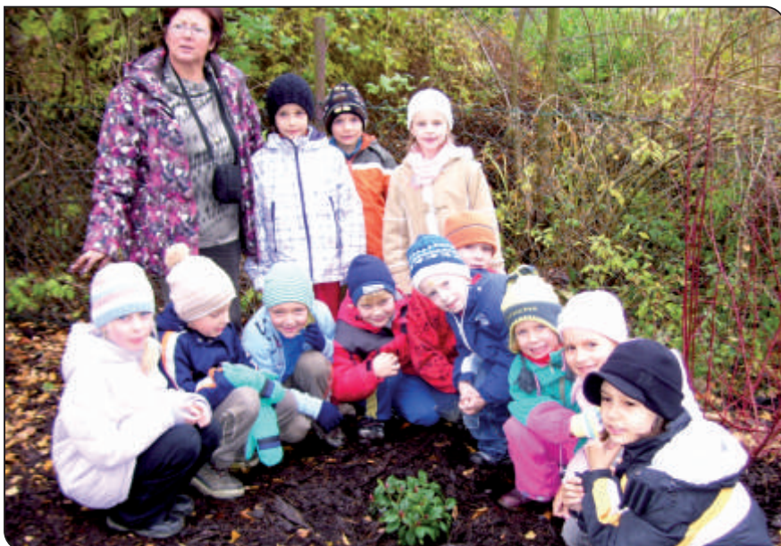
Podzimní poklad zahradního skřítky

Naše tradiční akce „Sázení keřů prvňáčků“ proběhla 9. listopadu 2009 na naší školní zahradě. Obě 1. třídy si zakopaly poselství pro příští generace ke kořenům azalky a rododendronu. Tím se nám rozrostl náš okrasný družinový záhon.