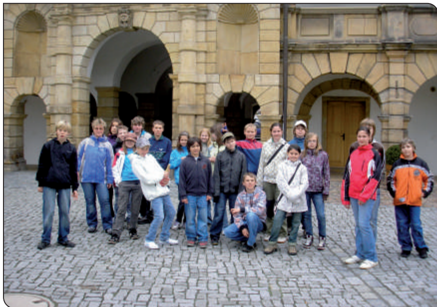
Školní výlet 6. třídy