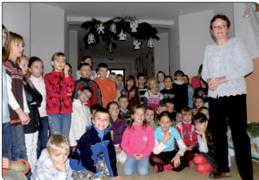
Adventní čekání, zpíváme koledy