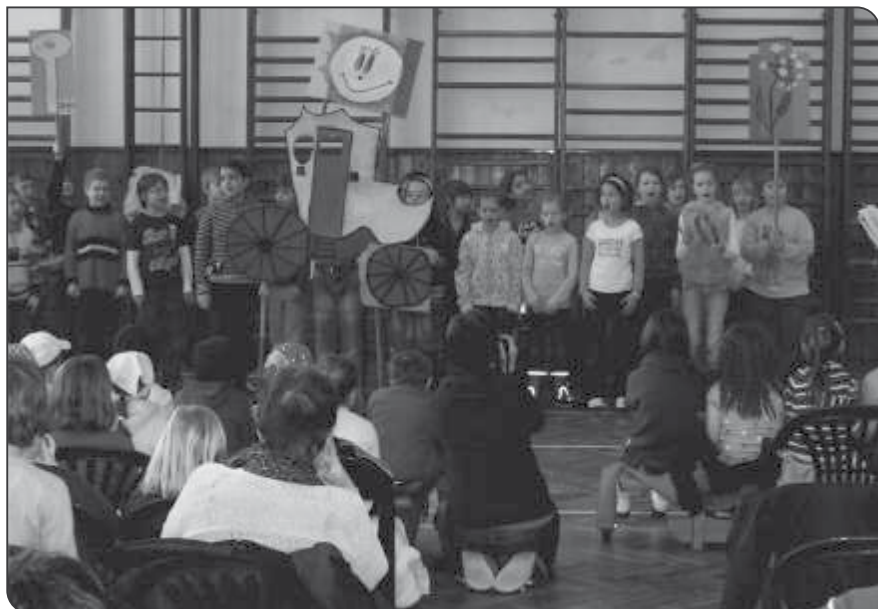
Školní kolo pěvecké soutěže