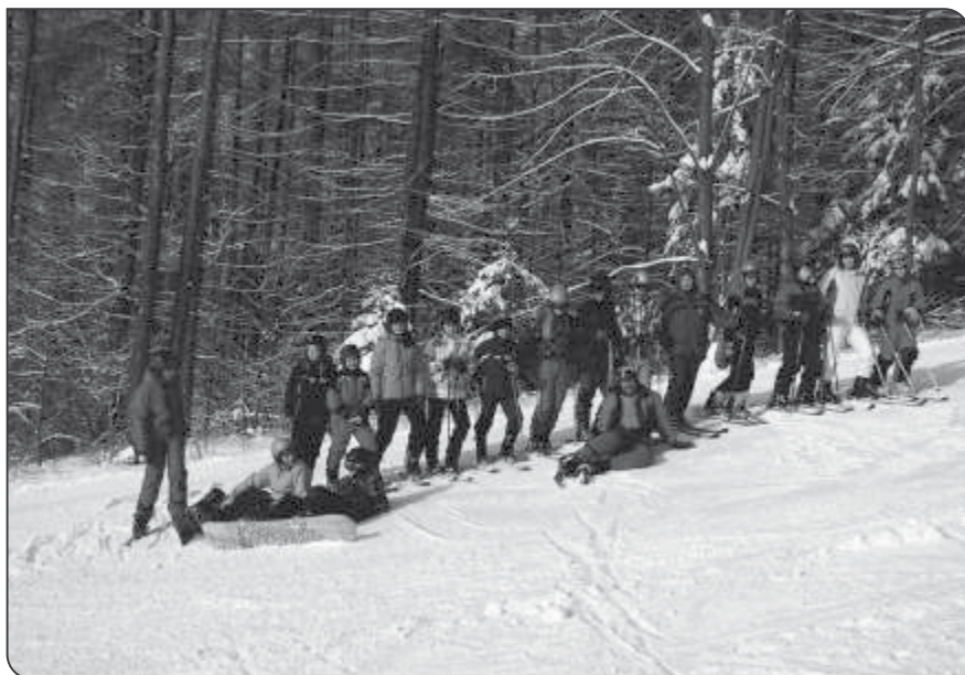
7. třída na LVVZ v Janoušově

Ubytování: pension „LESANKA“. Kurz probíhal v oblasti ORLICKÝCH HOR v malebném prostředí přehrady na řece Divoké Orlici.