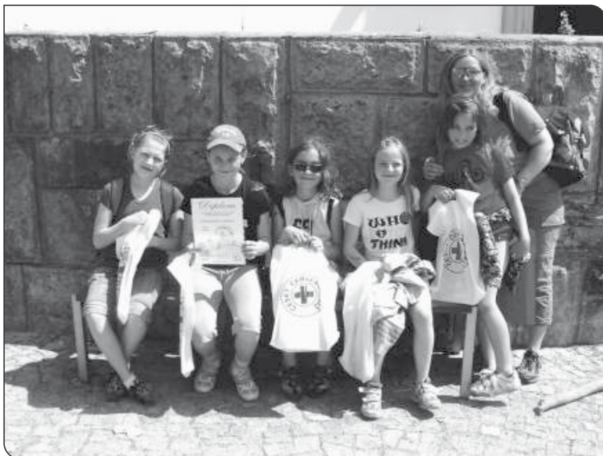
Zdravotníci – družstvo I. stupně

Podruhé proběhl na konci školního roku. S jakými výsledky? Na prvním místě opět třída 2.B (13,5 kg na žáka), na druhém třída 3. (7,7 kg na žáka) a na třetím třída 4 (6,8 kg na žáka). Vítězná třída pokaždé získala sladkou odměnu.