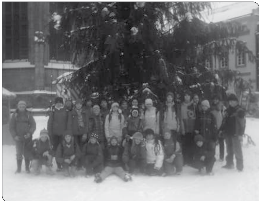
6. třída ve vánoční Praze