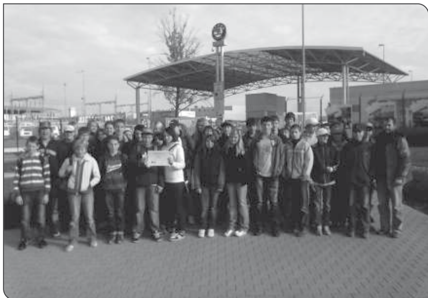
Exkurze do závodu ŠKODA AUTO

V programu „Odpady“ byli žáci seznámeni s důležitostí třídění a omezení vzniku odpadu a možnostmi recyklace. Zkusili si třídít nejběžnější domovní odpad, prohlédli si výrobky z recyklovaných odpadů. Lektorka se snažila o to, aby děti pochopily, že každý má vlastní podíl zodpovědnosti na stavu životního prostředí.