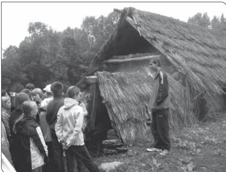
V archeologickém skanzenu Villa Nova Uhřínov

Po rozlosování v kmenových třídách se žáci sešli ve skupinách, kde nejdříve proběhla celosvětová soutěž Matematický klokan. Následně se rozdělili do rodin a každý žák dostal svoji roli v rodině. A hned potom začaly pracovat menší skupiny/rodiny. V prvním bloku byla na programu historie české měny, citáty o financích a majetku a lidová přísloví o penězích. V druhé části se rodiny pokusily sestavit alespoň vyrovnaný rodinný rozpočet a seznámily se se základními finančními pojmy. V poslední části došlo k plánování dovolené, k nákupu auta, bytu nebo rodinného domu. Ve formě pexesa si žáci procvičili znalost používané měny v jednotlivých státech světa. Součástí projektu byl výstup, ve kterém žáci uplatnili svoje výtvarné nadání a zpracované úkoly.