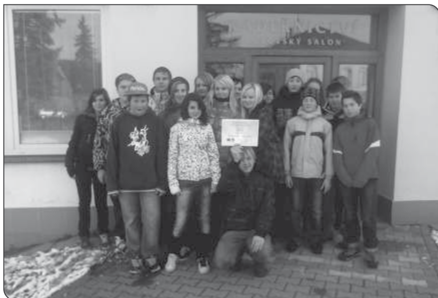
Žáci devátých tříd navštívili SOŠ a SOU Lanškroun

Ve středu 22. září se ve 2.B uskutečnil celodenní projekt Dopravní výchova. Ráno to možná vypadalo jenom na hraní, ale během dopoledne se děti přesvědčily, že kreslením a hraním her se dá hodně naučit. Nejprve nám paní učitelka přečetla pohádku O staviteli Vítkovi, který stavěl město, ale na spoustu věcí zapomněl. Poradili jsme mu, co všechno je ve městě důležité, aby se nám v něm dobře bydlelo. Zopakovali jsme si důležitá telefonní čísla a povídali si, v jakých situacích je můžeme potřebovat. Těžké bylo třeba i umět se představit do telefonu, popsat situaci a na nic důležitého nezapomenout. Bavilo nás povídání o dopravních prostředcích