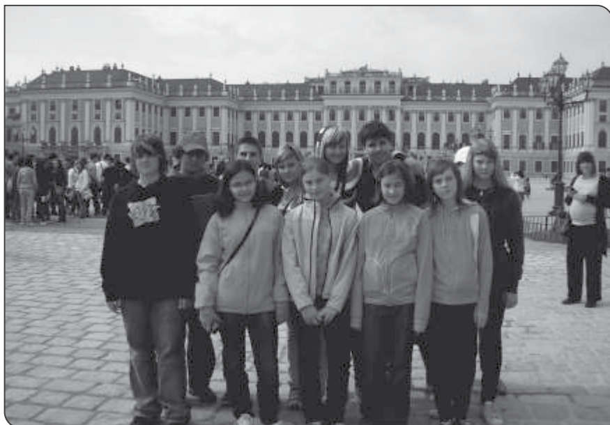
Vzdělávací zájezd do Vídně

Ve čtvrtek 5. května 2011 se žáci sedmého ročníku zúčastnili exkurze do iQparku v Liberci. Celý komplex IQparku je koncipován jako interaktivní zábavně naučné science centrum. Exponáty jsou v maximálně možné míře názorné a interaktivní – umožňují zapojení návštěvníka do jejich fungování, umožňují pochopení