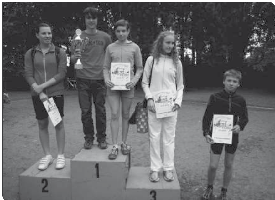
Sportovní slavnosti - vyhlášení škol

Dobrá nálada, přízeň sponzorů (Drogerie TETA) a některé velmi kvalitní