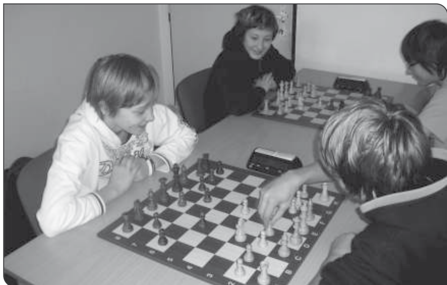
Krajské finále přeboru škol

Beskydská šachová škola ve spolupráci se Střediskem volného času Klíč uspořádala Mistrovství České republiky škol v šachu 2011 v kategorii 1. – 5. tříd. Mistrovství se uskutečnilo ve dnech 12. – 13. dubna v Hotelu Petr Bezruč v Malenovicích. Na startu se sešlo 29 nejlepších čtyřčlenných školních týmů ČR.