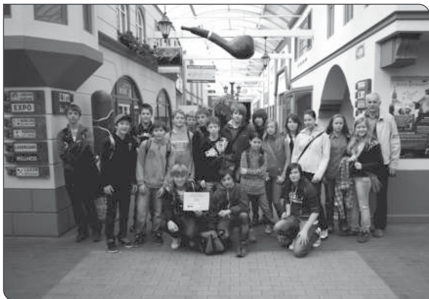
Sedmá třída v IQparku Liberec

Od rána nás vítal krásný slunečný den jako stvořený pro výlet. Vydali jsme se směr Chrudim a Slatiňany do Lanového centra Podhůra. Kromě dětského lanového okruhu jsme využili také lezeckou stěnu, hřiště, lesní tělocvičnu a daleký výhled byl z rozhledny Bára. Na lanovém okruhu se druháci vystřídali ve třech skupinách. Po oblečení postrojů a helem jim instruktoři ukázali zacházení s karabinou a co je na trati čeká. Následujících osm překážek zvládli všichni překonat, ale největší úspěch mělo závěrečné svezení na lanové klouzačce. Během dopoledne jsme si doplňovali také přírodovědné znalosti. V lese jsme pozorovali mraveniště, u jezírka vážky, a dokonce jsme si prohlédli i skokana hnědého, slepýše nebo sojku. Po obědě jsme se přesunuli do Chrudimi do Muzea loutek. Ve starobylém měšťanském domě jsme