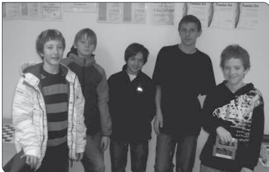
Přebor škol v šachu – okresní kolo 1. – 5. tříd

V okresním kole Přeboru škol 1. – 5. tříd se sešlo pět týmů základních škol. Vedle tří lanškrounských se prezentovala čtyřčlenná družstva ZŠ Komenského Ústí nad Orlicí a ZŠ Libchavy. Hrál se ve čtvrtek 18. listopadu 2010 v Dělnické domě každý