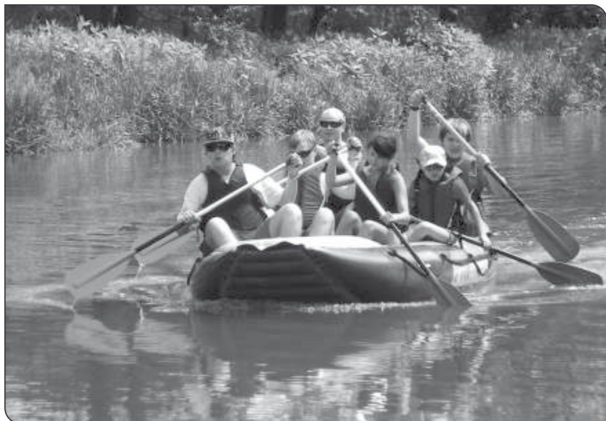
Vodácký kurz na Sázavě

2. den středa 15. 6. 2011: Přejezd vlakem do Chřenovice-Podhradí, převzetí raftů a plavba na raftech zpět do Zruče.