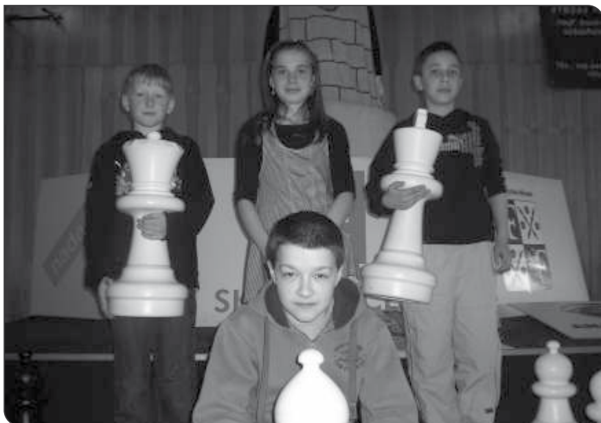
Mistrovství České republiky škol v šachu 2011

V sobotu dne 7. května 2011 se ve Svitavách konal další vrcholný turnaj letošní mládežnické šachové sezóny. V pěkných prostorách multifunkčního centra Fabrika se uskutečnil Krajský přebor mládeže v rapidu ve čtyřech věkových kategoriích. Vedle medailí byly ve třech kategoriích ve hře i postupy na Mistrovství České republiky.