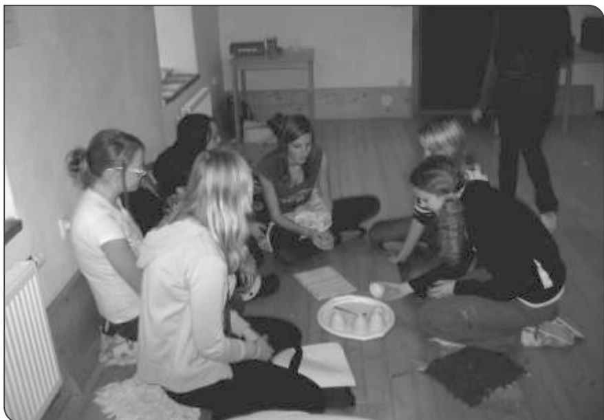
Ekocentrum Paleta v Oucmanicé