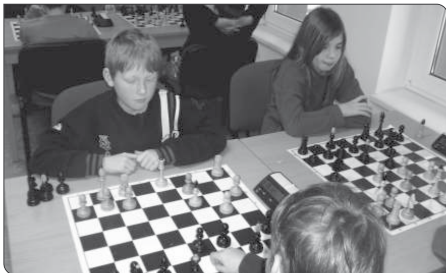
Přebor škol v šachu – krajské kolo 1.- 5. tříd