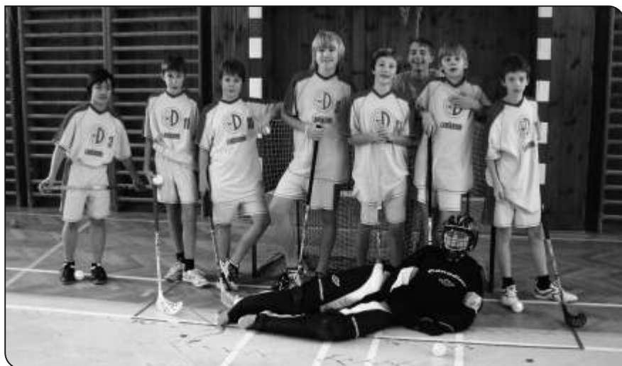
Družstvo na okrskovém florbalu