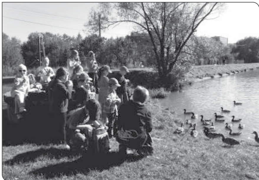
Podzimní výlet 2.B

Podařilo se nám vyprosit si od podzimu ještě jeden slunečný víkend a v sobotu 9. října jsme se mohli vypravit do přírody. Sešlo se nás jedenáct i s některými