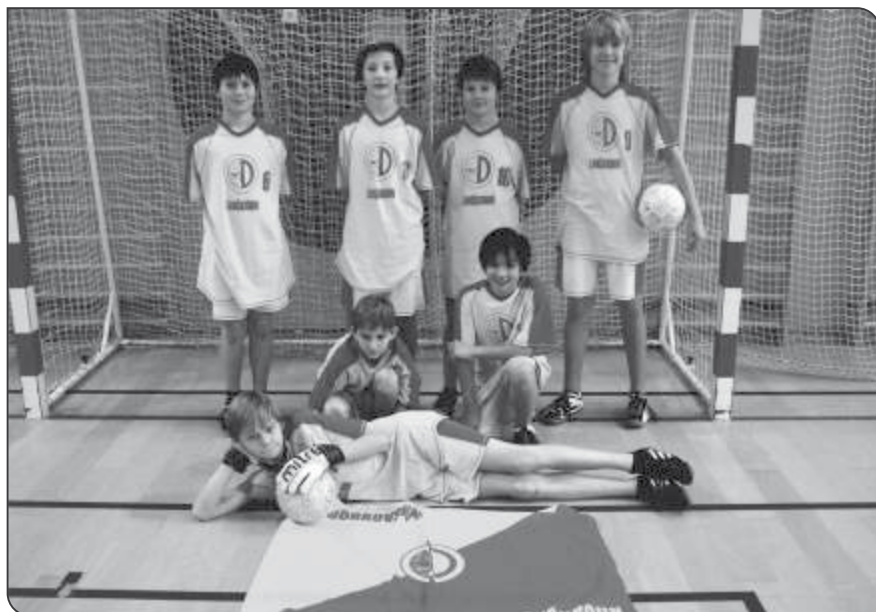
Okrskové kolo v sálové kopané

Kolem osmé hodiny jsme dorazili do okresního města. Cestou na sportovní