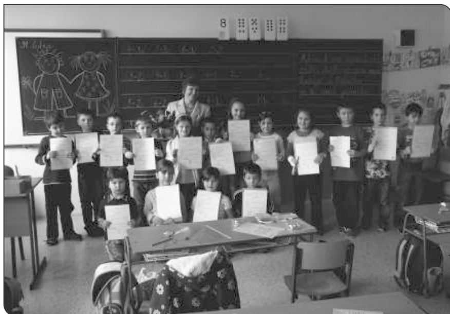
První vysvědčení 1.B

Už od Vánoc jsme se těšili na letošní bruslení, během února a března jsme se na kluziště vypravili celkem 4x. Druháci chodili bruslit už loni, ale pro některé prvňáčky to na ledě byla premiéra. Pro některé se stalo výkonem i samotné absolvování cesty na zimní halu. Po nekonečném šněrování bruslí zjišťujeme, že jsme toho mnoho nezapomněli a že bruslení přece jenom zvládneme. Druháci už bruslí sami, a proto pomáhají některým prvňáčkům. Během pár týdnů nás nohy v bruslích poslouchají stále více a na závěrečném karnevalu v maskách už většina