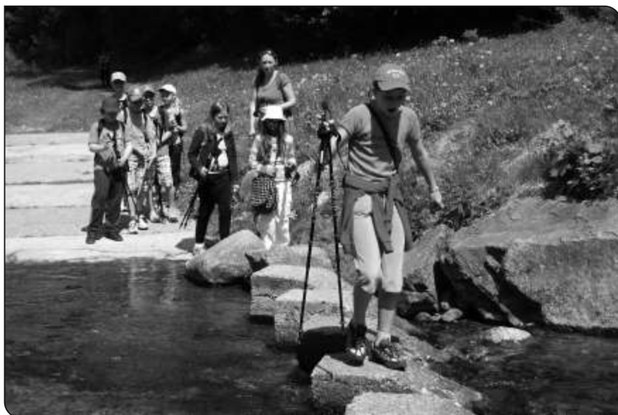
Turistika v Miedzygorze