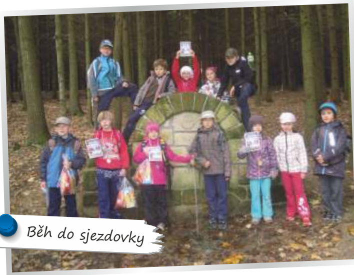
Běh do sjezdovky