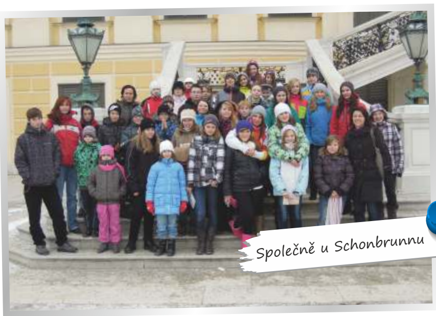
Společně u Schonbrunnu