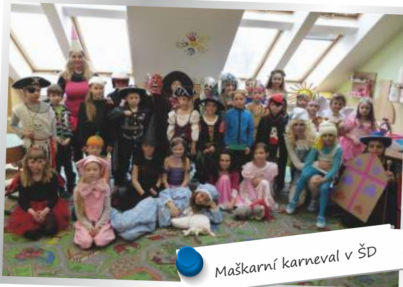
Maškarní karneval v ŠD