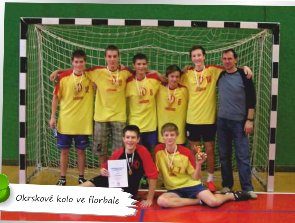
Okrskové kolo ve florbale